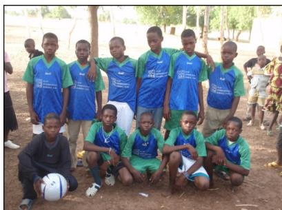
Equipe école de Bougrétenga