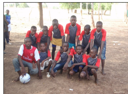
Equipe école franco-arabe