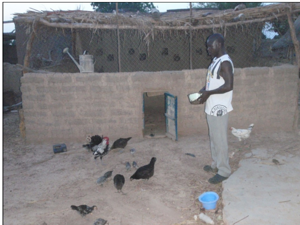
Photo d'un poulailler qui promet...

Nous n'oublions pas pour autant « l'opération Poules » ! Bien au contraire, car ce projet ne peut qu'améliorer le quotidien et favoriser l'autonomie économique des familles.