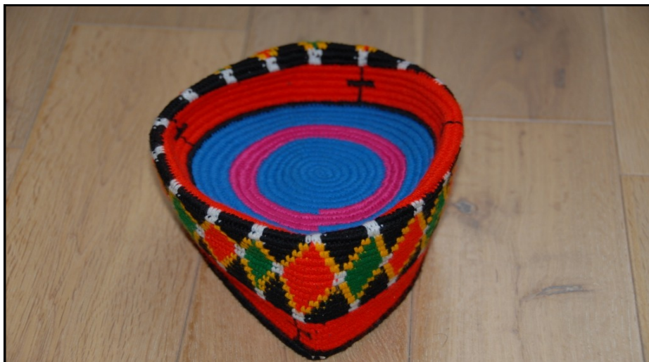
Le chapeau royal

Désormais, suivant les coutumes, les deux notables ne peuvent plus être appelés de leur nom d'état civil mais respectivement « Sugr Naaba » et « Kulbalin Naaba ». Ils participeront activement, aux côtés du chef, à l'administration du village suivant les traditions ancestrales. Il faut rappeler que la présidente de Burkina Songré a elle aussi été nommée chef en 2008 comme « Malgr Naaba » (chef du développement). Sa majesté devra un jour sacrifier aux rites d'intronisation pour porter pleinement la charge qui lui revient, symbolisée par le chapeau royal qui lui a été remis.