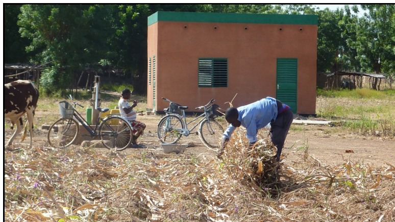
Le Moulin à grains