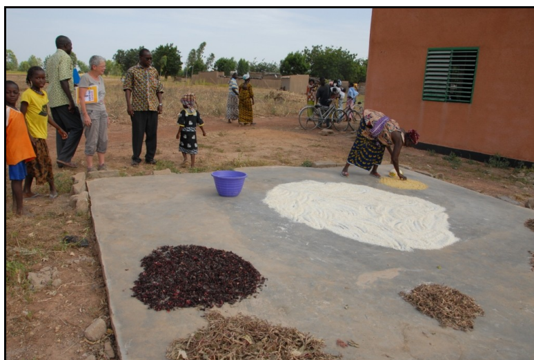
L'aire de séchage