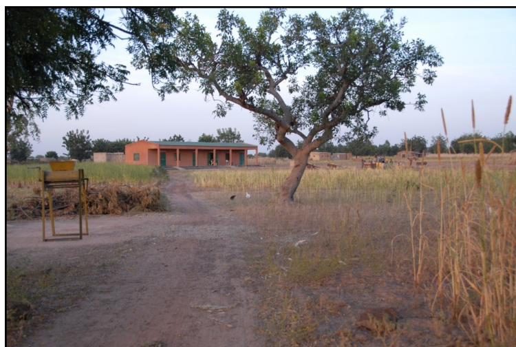
Le Centre Multi Services