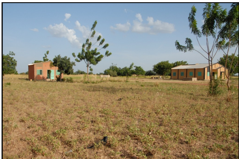
La maternité et le dépôt pharmacie-