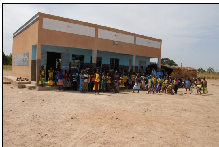
L'école B, classe de CM2