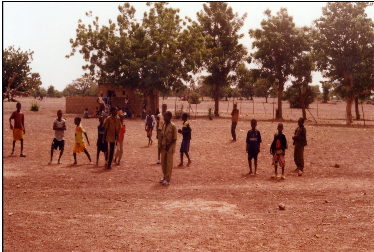
La récréation des enfants du village à Bougrétenga